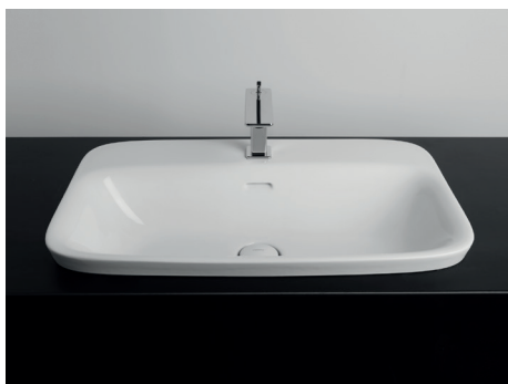
70 x 42 h4

Lavabo in ceramica da incasso con troppo pieno e quattro lati smaltati. Piletta esclusa.