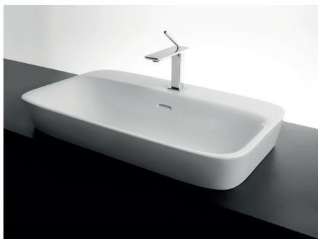
70 x 42 h10

Lavabo in ceramica da incasso con troppo pieno e quattro lati smaltati. Piletta esclusa.