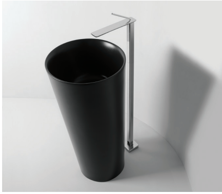
FREESTANDING Scarico a terra

Lavabo freestanding in ceramica con scarico a terra senza troppo pieno. Piletta esclusa.