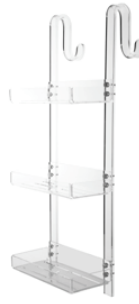
1143 Portaoggetti 3 piani da appendere con gancio 3 level accessories holder with hook mount L. 310 H. 800 P. 270 mm