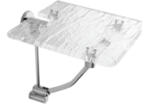
K131 Sgabello pieghevole plexiglass ghiacciato, portata max 130 Kg Folding stool ice effect plexiglass maximum capacity 130kg Aperto/Open L. 280 H. 325 P. 345 mm Chiuso/Closed L. 280 H. 565 P. 100 mm