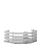
1331 Angolare doccia Corner shower shelf L. 198 H. 120 P. 205 mm