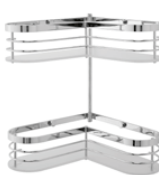
1313 Angolare doccia Corner shower shelf L. 275x275 H. 325 P. 100 mm