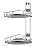
0883 Angolare doccia Corner shower shelf L. 180 H. 390 P. 200 mm