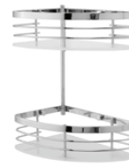
1303 DX/SX Angolare doccia Corner shower shelf L. 250 H. 325 P. 170 mm