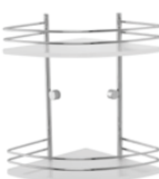
1583 Angolare doccia con ringhiere Corner shower shelf with rail L. 205 H. 300 P. 205 mm