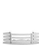
1321 Angolare doccia Corner shower shelf L. 220 H. 85 P. 220 mm