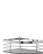
1301 DX/SX Angolare doccia Corner shower shelf L. 250 H. 80 P. 170 mm