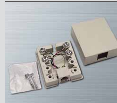
Presa da parete per 1 PLUG 6/4.