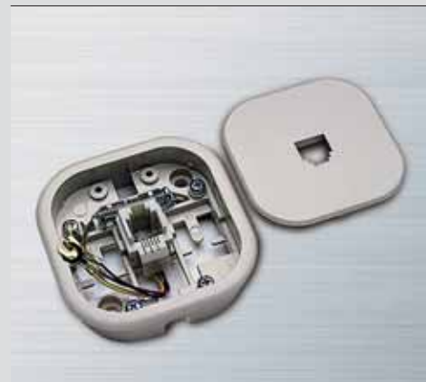
Presa da parete e incasso per 1 PLUG 6/4.

Scame propone, all'installatore qualificato, una serie di prodotti in grado di soddisfare la quasi totalità delle richieste più comuni sia di cablaggio che di espansione dell'impianto telefonico.