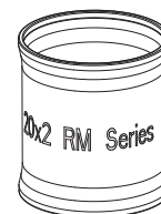
Caratteristiche delle bussole

Dettaglio bussola (rif.3 tab.2) - la scritta RM Series sta ad indicare che il raccordo può essere pressato con le pinze indicate in tabella 1.