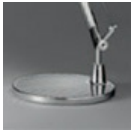
TOLOMEO MIDI BASE ALL A003900