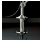
TOLOMEO MORSETTO A004100