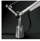
TOLOMEO SUPP.TAVOLO FISSO A004200