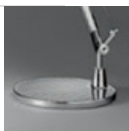
TOLOMEO BASE TV ALL D230 A004030