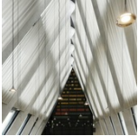
› Fondazione Feltrinelli