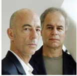
› Herzog & De Meuron