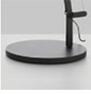
DEMETRA LED T BASE GRO 1733010A