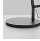
DEMETRA SUPPORTO F GRO 1741010A