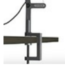
DEMETRA MORSETTO GRO 1744010A