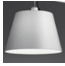
TOLOMEO MEGA DIFF.RASO 420 0781030A