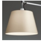
TOLOMEO MEGA DIFF.PERG.520 0780060A