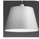
TOLOMEO MEGA DIFF.RASO 520 0781060A