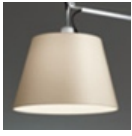
TOLOMEO MEGA DIFF.PERG.420 0780030A