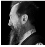
› Michele De Lucchi