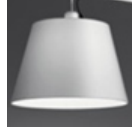
TOLOMEO MEGA DIFF.RASO 360 0781020A