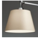
TOLOMEO MEGA DIFF.PERG.360 0780020A