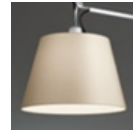
TOLOMEO MEGA DIFF.PERG.420 0780030A