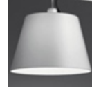
TOLOMEO MEGA DIFF.RASO 420 0781030A