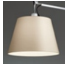
TOLOMEO MEGA DIFF.PERG.320 0780010A