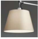
TOLOMEO SOSP/PTE DIFF.PERGAMENA D.240 0372050A