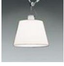
TOLOMEO SOSP/PTE DIFFUSORE RASO D.240 0781050A