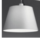
TOLOMEO MEGA DIFF.RASO 320 0781010A